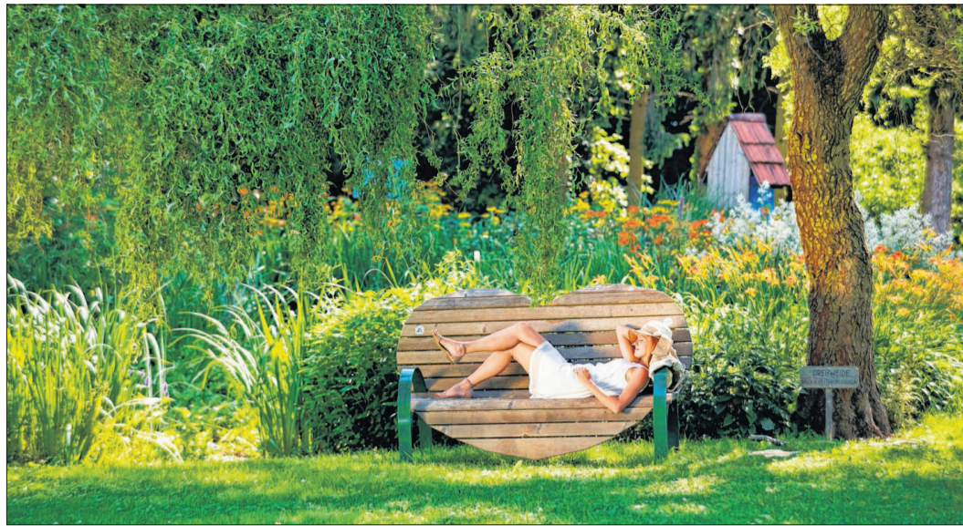
Stauden gehören eigentlich in jeden Garten: In diesem Jahr fällt das Augenmerk auf die reich blühenden und pflegeleichten Bergenienarten.